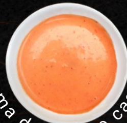
Crema de Rocoto casero