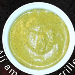
Aji amarillo parrillero