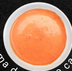
Crema de Rocoto casero