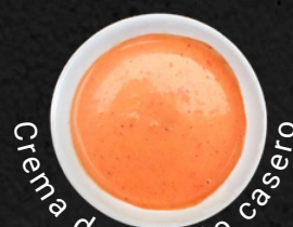
Crema de Rocoto casero