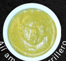
Aji amarillo parrillero