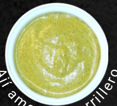
Ajil amarillo parrillero