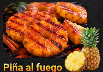
Piña al fuego