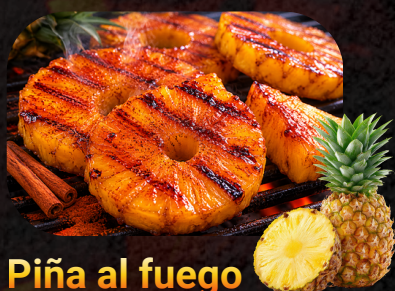
Piña al fuego Cortesía de la casa