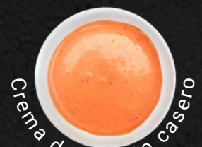
Crema de Rocoto casero