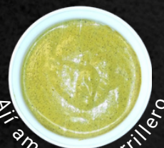
Aji amarillo parrillero