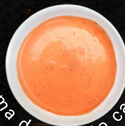
Crema de Rocoto casero