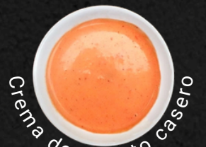
Crema de Rocoto casero