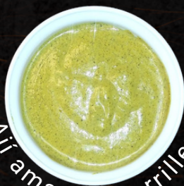
Aji amarillo parrillero